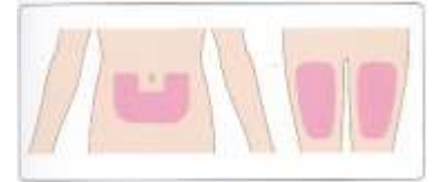
図 1 投与部位について

腹部又は左右の大腿部に皮下投与 (右図参照)。本剤を繰り返し皮下投与する場合、特に週 1 回投与 (1~3 コース目) では、腹部、左右の大腿部等に交互に投与するなど同一注射部位を避けること (図 1 参照)。