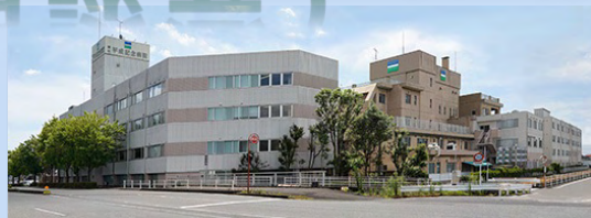
藤枝平成記念病院