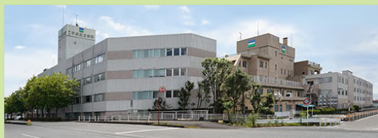
藤枝平成記念病院