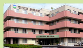
介護老人保健施設 マインド (入所：150名、通所：40名)