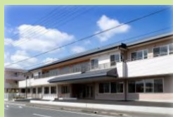
特別養護老人ホーム かなや (入所：70名、通所：15名)