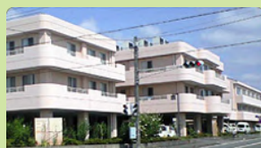
介護老人保健施設 エコトープ (入所：150名、通所：40名)