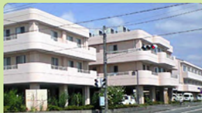
介護老人保健施設 エコトープ (入所：150名、通所：40名)