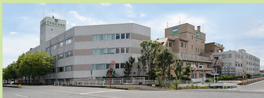
藤枝平成記念病院 (病床数：199床、病院デイケア：20名)