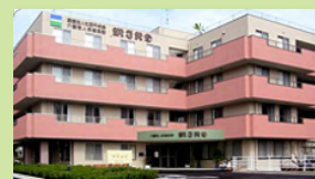
介護老人保健施設 マインド (入所：150名、通所：40名)