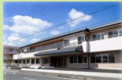
特別養護老人ホーム かなや (入所：70名、通所：15名)