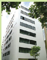
築地神経科クリニック ＜東京都中央区築地＞ 東京ガンユニットセンター(18床)