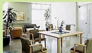
介護老人保健施設 カリタス・メンテ (入所：50名、通所：20名)